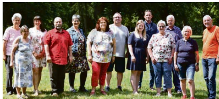
Mitglieder des Seniorenbeirates im Stadtpark. Das Foto entstand im vergangenen Jahr im Zusammenhang mit dem 2023 erschienenen neuen Seniorenratgeber „Kompass fürs Alter - Wegweiser für Wohnen, Pflege, Freizeit“. Diesen brachten der Seniorenbeirat der Stadt Sömmerda, die Stadtverwaltung Sömmerda und das Landratsamt gemeinsam heraus.

Parcoursfläche der Kreisverkehrswacht behaupten und mit dem Fahrrad eine vorgegebene Strecke absolvieren. Zuletzt wurden alle Bewertungsbögen der Jugendlichen ausgewertet und die Gewinner mit attraktiven Preisen gekürt. Für alle Mitmachenden gab es einen 10 Euro-Tankgutschein.